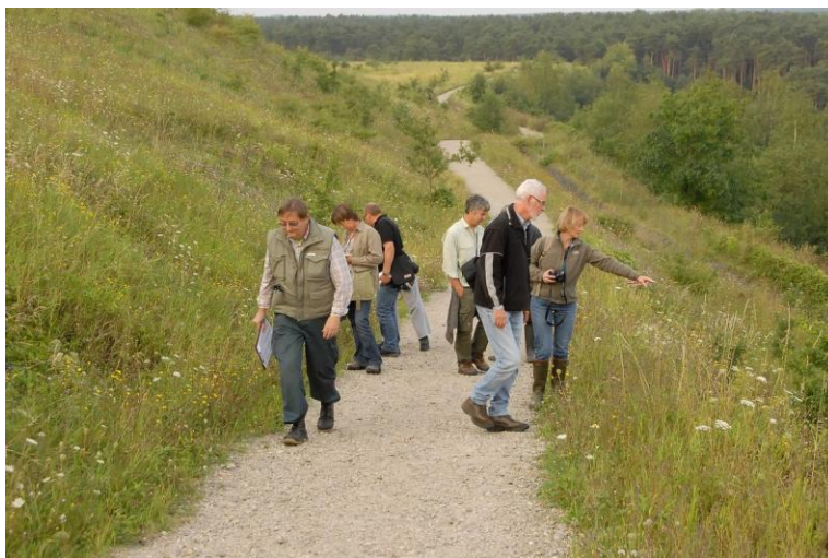
hijgende slobkousen op weg naar de top