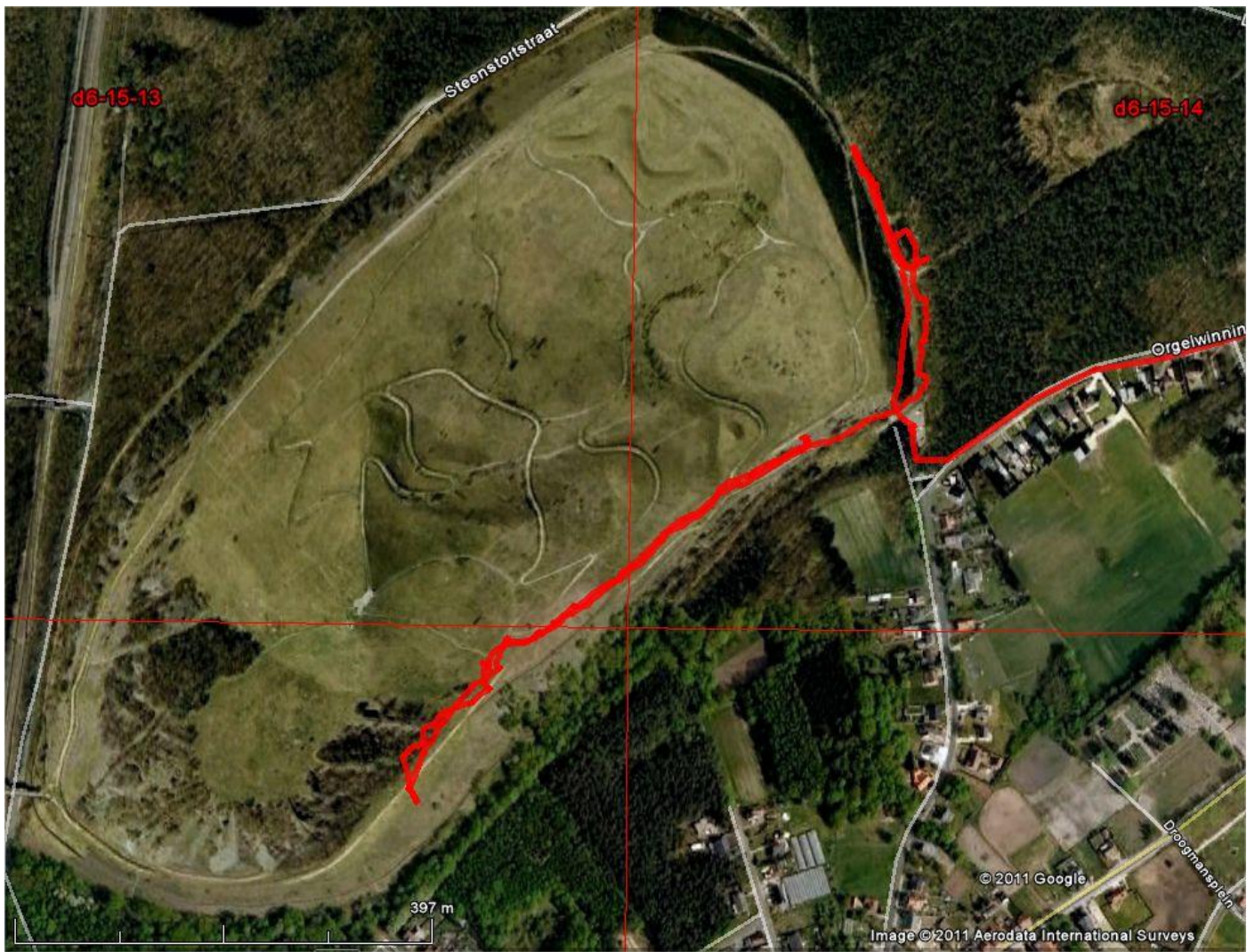
de gevolgde weg